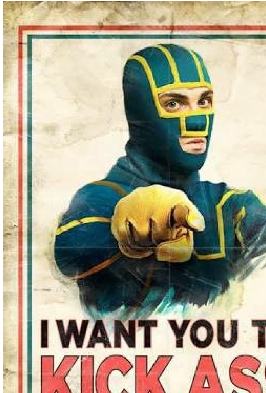
GSB Frühjahrsevent - 10.04.2019